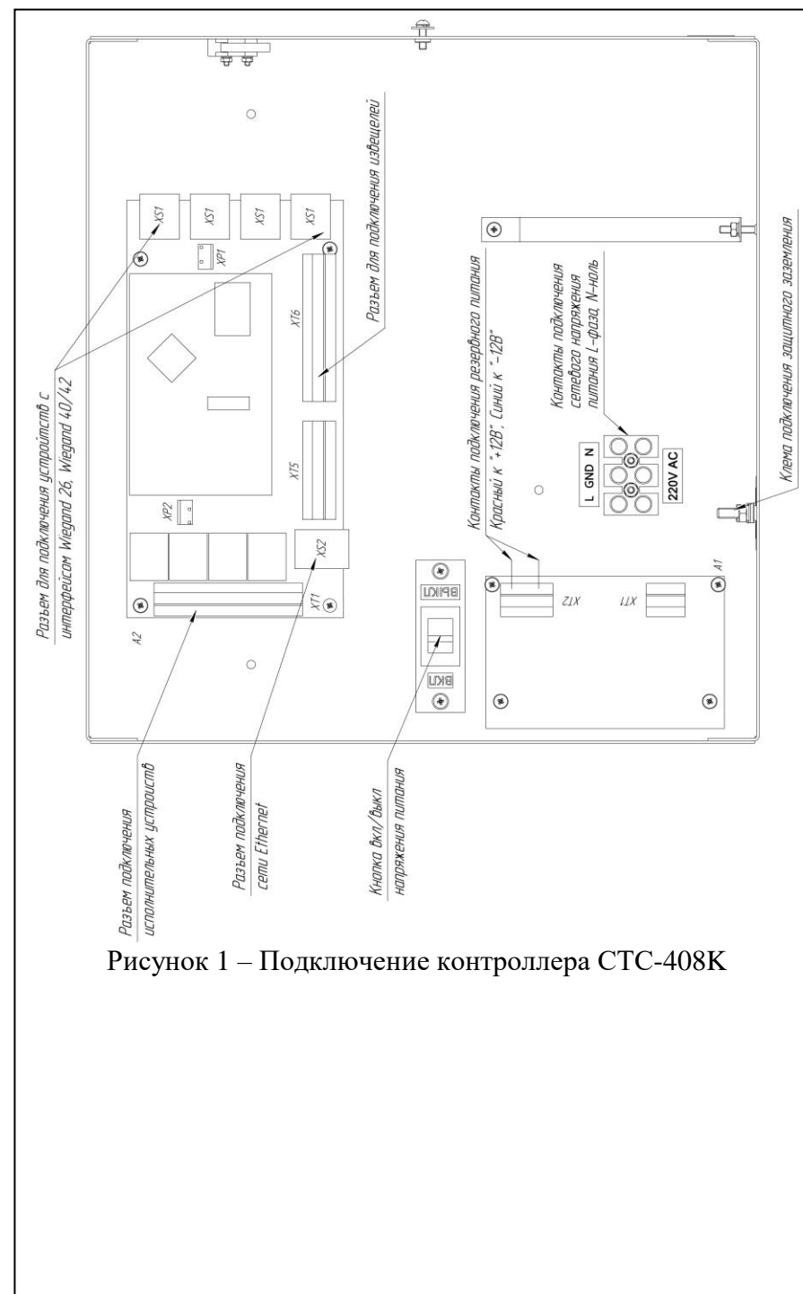
Рисунок 1 – Подключение контроллера СТС-408К